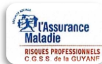
Service Risques Professionnels de la CGSS