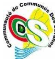
Communauté de Communes des Savanes